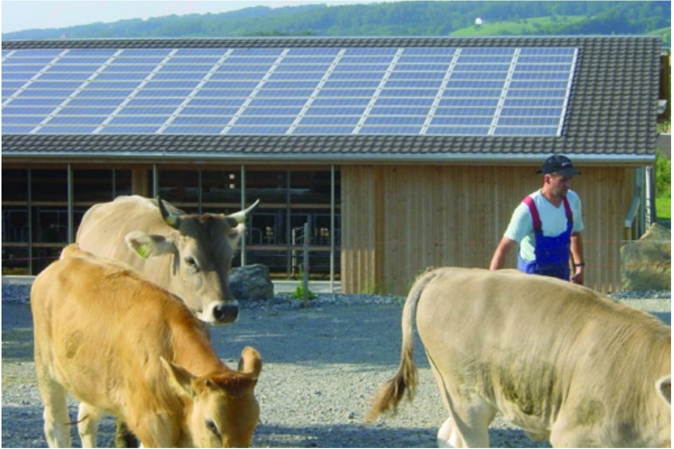
20 bis 30 Grad Neigung in südlicher Exposition sichert den besten Stromertrag. Die Faustregel lautet: 7 Quadratmeter Fläche für ein Kilowatt Spitzenleistung. Die damit produzierbare Energie wird im Mittel auf 930 kWh pro Jahr geschätzt. Anlage auf dem Süddach des Stalls beim Kloster Baldegg LU.