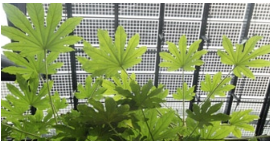
Transluzide Photovoltaikelemente, für lichtdurchflutete Räume wie z.B. Gewächshäuser geeignet.