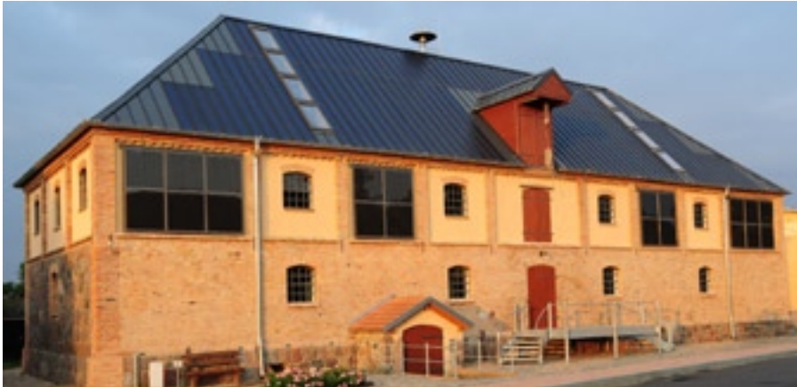
Kornspeicher in Brandenburg mit integrierten PV-Dünnschichtzellen auf dem Dach und kristallinen Modulen an der Fassade.

die entsprechenden Anschlüsse befügt. Die ordnungsgemässe Funktion wird nach der Fertigstellung durch eine Inbetriebnahmemessung vor Übergabe an den Betreiber der Anlage dokumentiert. Befindet sich am Haus ein Blitzschutzsystem, so ist zusätzlich eine Blitzschutzfachkraft beizuziehen, um die Photovoltaikanlage in das Blitzschutzsystem zu integrieren.