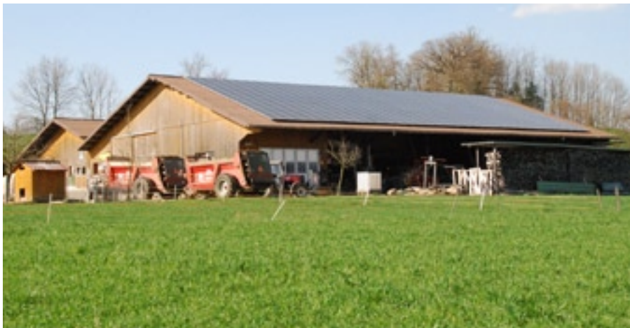
Um in den Genuss der kostendeckenden Einspeisevergütung KEV zu kommen, ist es wichtig, ein Gesuch möglichst frühzeitig einzureichen. Der Eigentümer dieser 50-kWp-PV-Aufdachanlage in Wohlenschwil AG hatte den richtigen Zeitpunkt erwischt.