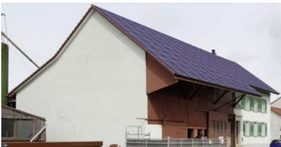
Beispiel einer Fotomontage für eine Indach-Anlage.

Noch vor der Auslegung mit einem bestimmten Modultyp ist damit bekannt, wie geeignet eine Fläche für die Solarstromproduktion ist (vgl. Abb. 2). In einer Machbarkeitsstudie kann damit die Wirtschaftlichkeit eines PV-Projektes schlüssig beurteilt werden.