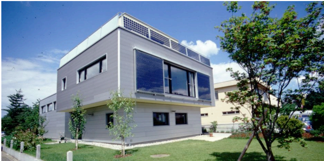
Abb. 4 Modulkonfiguration