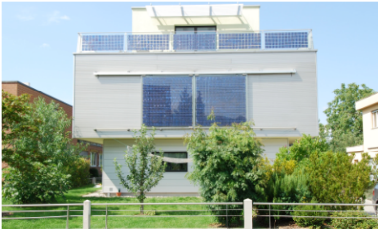
Abb. 5 Beispiel eines Passivhauses mit fassaden- und dachintegrierter PV

In der Pionierphase des PV-Marktes könnten architektonisch gelungene PV-Integrationen der solaren Stromerzeugung zum Durchbruch verhelfen. PV an Gebäudehüllen ist mehr als „fashion“: sie wird zum Hebelarm, mittels welchem die Solarisierung unserer Gesellschaft sinnhaft Werte transportiert. Diesen Effekt gilt es neben rational-technischen Überlegungen zu Gunsten der Breitenanwendung von PV bei der Gebäudeintegration noch gezielter zu nutzen.